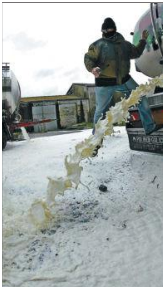
Ganaderos tiran leche como protesta en Galicia.

La cuota española de producción supone dos terceras partes de la demanda